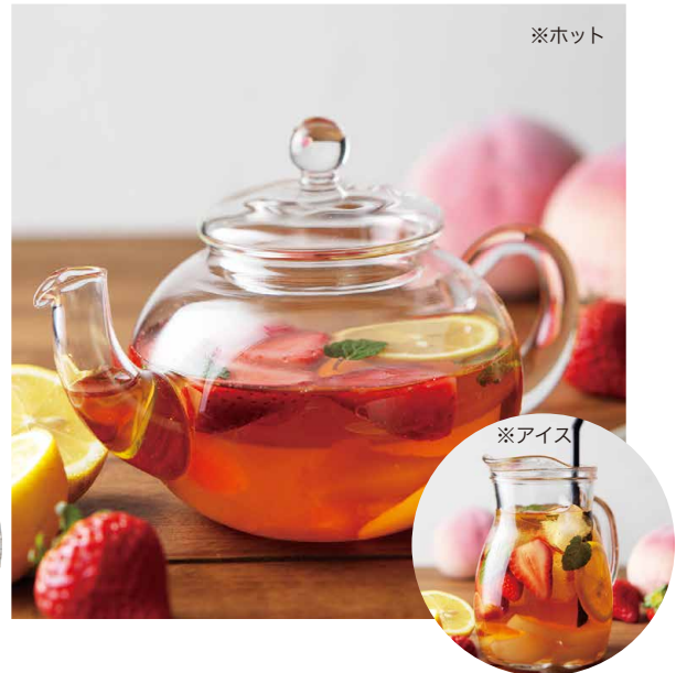
ストロベリー&ピーチ (ホット/アイス)

香り高いムレスナティーハウスの紅茶に、莓・もも・レモンを合わせた華やかな香りがお楽しみいただけるフルーツティーです。