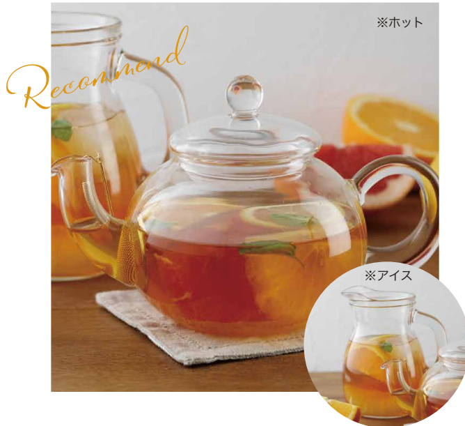
柚子シトラス (ホット/アイス)

ムレスナティーハウスのアダムスピークで淹れたブラックティーをベースに2種のグレープフルーツ、レモン、オレンジ、スペアミントの風味をつけ柚子で爽やかに仕上げたフルーツティーです。